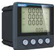
PD666-S3 Трехфазный многофункциональный измеритель с ЖК-дисплеем