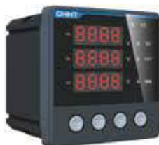
PD666-S4 Трехфазный цифровой многофункциональный измеритель