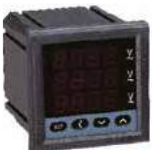
PA/PZ7777-S Трехфазный цифровой амперметр, вольтметр