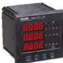
PD7777-S4 Трехфазный цифровой многофункциональный измеритель