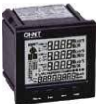
PD7777-S3 Трехфазный цифровой многофункциональный измеритель с ЖК-дисплеем